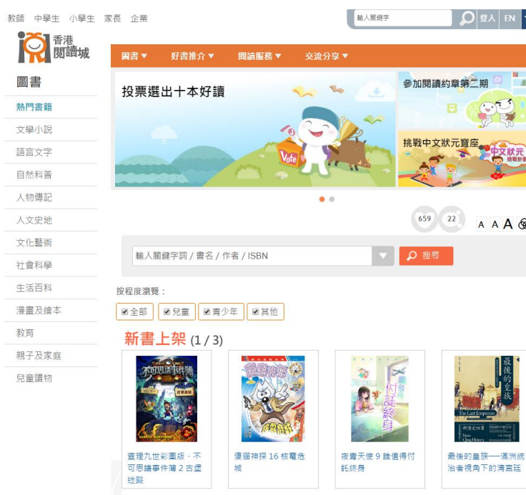
图 1：“香港阅读城”主页 [4]

自 2003 年成立以来，香港阅读城每年都会推出“十本好读”评选，旨在鼓励和推荐优质读物，具体目标有三：①鼓励同学自主选择阅读材料，培养阅读兴趣；②鼓励同学建立在网上搜寻阅读信息的习惯；③正面表扬好书作者和出版商。 [3]