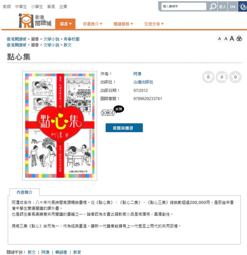
图 2：香港阅读城书目检索系统书目记录

香港公共图书馆的中、英文图书馆藏书分别以刘国钧的《中国图书分类法》及《杜威十进分类法》来分类。 [8] 过去 13 届“十本好读”获选的 130 种图书均为中文图书，根据刘国钧的《中国图书分类法》可归纳如下：